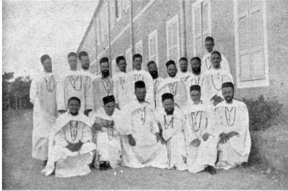
Les dix-huit élèves suisses du Séminaire des Pères Blancs de Thibar (Tunisie)

Il vaut bien la peine de faire des efforts pour réaliser une si belle vocation. Ce contact avec les âmes, pour les sanctifier, ou du moins pour préparer leur sanctification, me fit sentir un peu la justesse de cette vérité qu'en sanctifiant les autres on contribue par là même à se sanctifier soi-même. Mais je sais que d'abord et avant tout il faut se sanctifier soi-même.