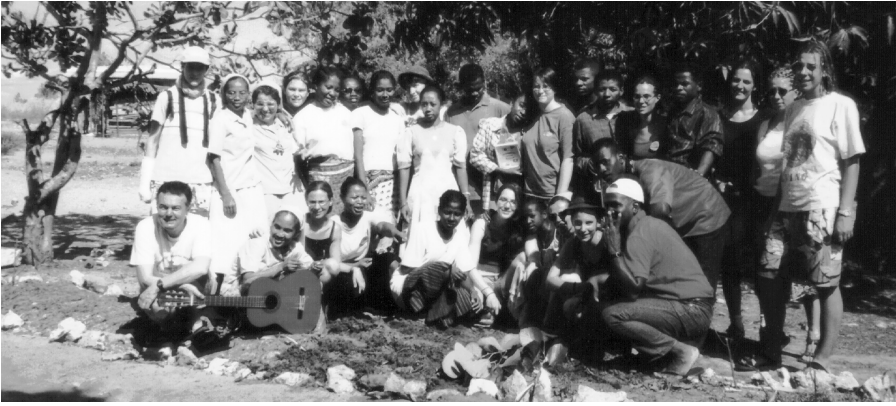
Évènement hautement symbolique : A la fin du camp interculturel, nous avons planté l'arbre de la paix. Et pas n'importe quel arbre, puisqu'il s'agit d'un arbre du voyageur !

les moyens) sont déjà parés pour l'hiver : bottes, doudounes, bonnet. Pour l'exotisme, on repassera ! « Vazaha, eh vazaha », c'est comme ça que nous appellent les enfants à chaque coin de rue, nous qui avons la peau blanche ; ce n'est pas une façon de mendier, encore moins une insulte, ils nous ont remarquées, c'est tout. Et pourtant, ils auraient de quoi nous demander un peu d'aide ; déjà très jeunes ils déambulent dans la jungle urbaine, pieds nus, avec pour uniques vêtements quelques pièces de tissus rabibochées et une bonne couche de crasse. Souvent orphelins (l'espérance de vie s'approche de 50 ans), vivant dans des maisons faites de cartons lorsqu'ils ont de la chance, trouvant chaque jour eux-mêmes leur bol de riz, ce sont déjà des adultes à 5 ans. Et puis, il y a encore ce mendiant, âgé, sans bras ni jambes, qui trouve encore le courage de jouer de la guitare tant bien que mal alors que la Mercedes du ministre passe à côté