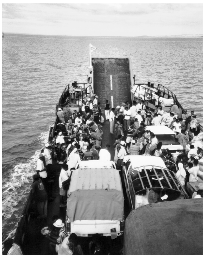
Beaucoup de monde sur le bac qui conduit vers les missions de brousse.