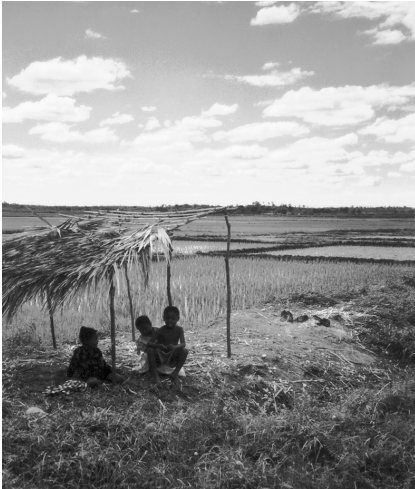
Près de la rizière, trois enfants s'abritent du soleil sous des branchages.

que j'atterris vraiment. En effet, l'île rouge, Madagascar, n'est plus un simple mot, c'est la réalité ; une réalité qui s'avère un peu dure pour nous qui venons du fin fond de notre Valais, une réalité qui relève d'un autre monde. Tôt le matin, je pars à l'aventure dans cette immense ville, avec ma sœur en guise de guide (elle travaille dans un dispensaire depuis presque une année). Il fait 15 degrés, j'ai presque trop chaud en T-shirt et je souris lorsque je m'aperçois que certains Malgaches (ceux qui en ont