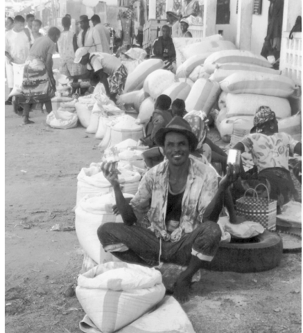
La joie du petit marchand de riz.