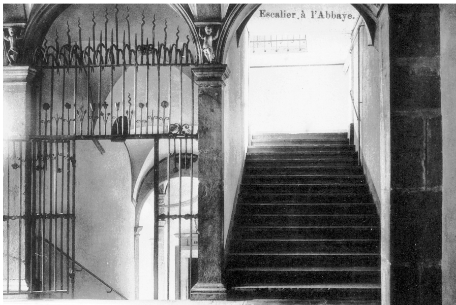
Reproduction d'une ancienne carte postale.

L'exécution eut lieu le 19 novembre 1791 (pour avoir plus de détails croustillants sur cette affaire, voir Jean-Émile Tamini et Pierre Délèze, Essai d'histoire de la vallée d'Illiez , [Saint-Maurice, Saint-Augustin], p. 202-208).