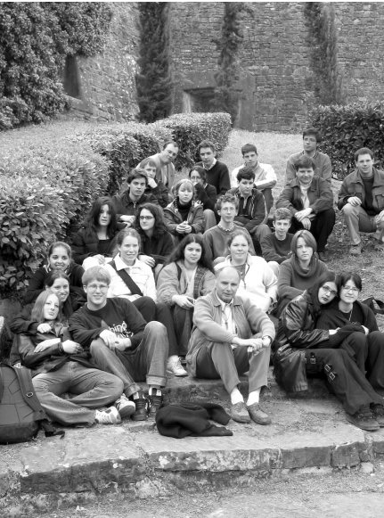
Le groupe des étudiants du pèlerinage Art et Foi à Florence.

L'Italie envoûte... Le voyage en Italie est une nécessaire initiation à la beauté. C'est ce qu'ont recherché 25