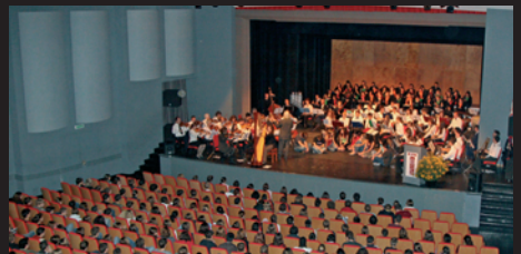
Quelques flashes sur la journée Portes Ouvertes du 28 avril.