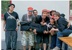
Ci-dessus, les membres de l'Agaunia en fête.

Au printemps 2006, du 3 au 7 mai, accompagnés de leur aumônier le chanoine Escher, neuf étudiants de l'Agaunia se rendaient à Rome pour participer aux 500 ans de la Garde Pontificale.